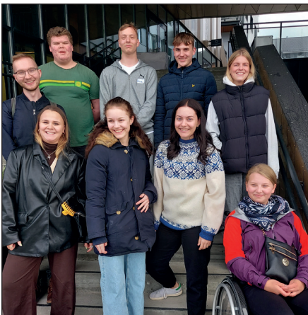
I løpet av helga lagde ungdomsrådet regler for hvordan de ønsker å jobbe sammen.