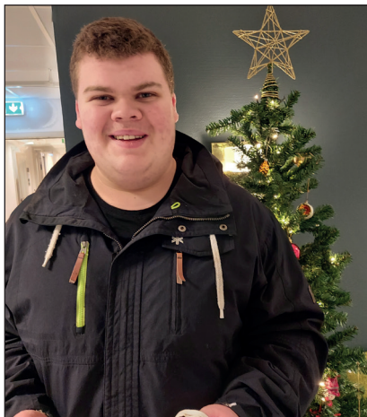
Innlegg 5. desember «Europa i krise, angår også ungdom i Nordland»