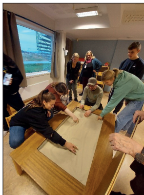
Omvisning på barne- og ungdomsklinikken, Bodø.