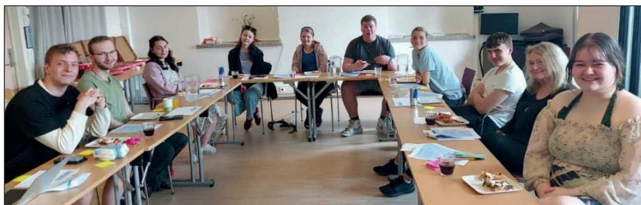
Møte på Lærings- og mestringssenteret i Bodø.