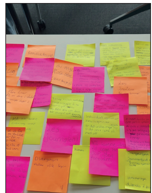
Noen bilder fra helgesamlingen, 22.-24. april i Bodø.