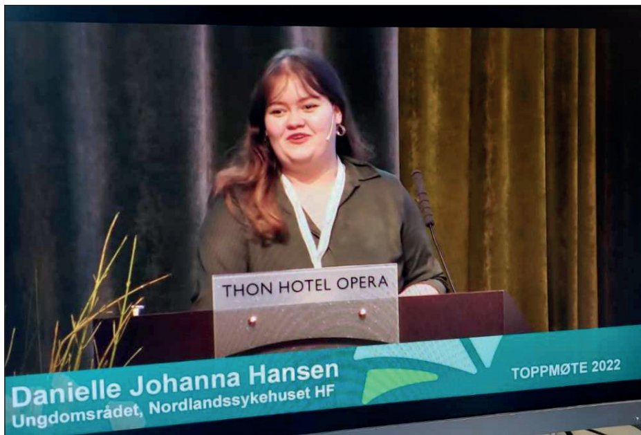
Toppmøte 2022, "Hvordan få til samarbeid? Brukermedvirkning og pårørendemedvirkning på individnivå".