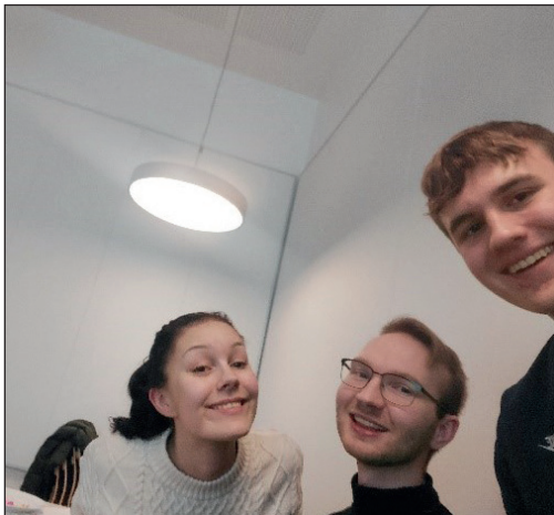
Årets siste møte, hvor «Nytt fra barneklubben» stod på dagsorden.